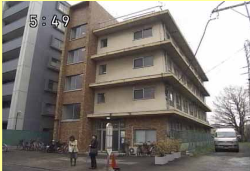
早朝の東京興議館寮全景