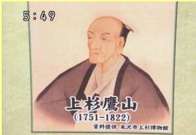
東京興譲館寮を「上杉鷹山の教えを守る学生寮」と紹介