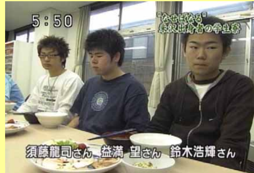
インタビューを受ける新入生