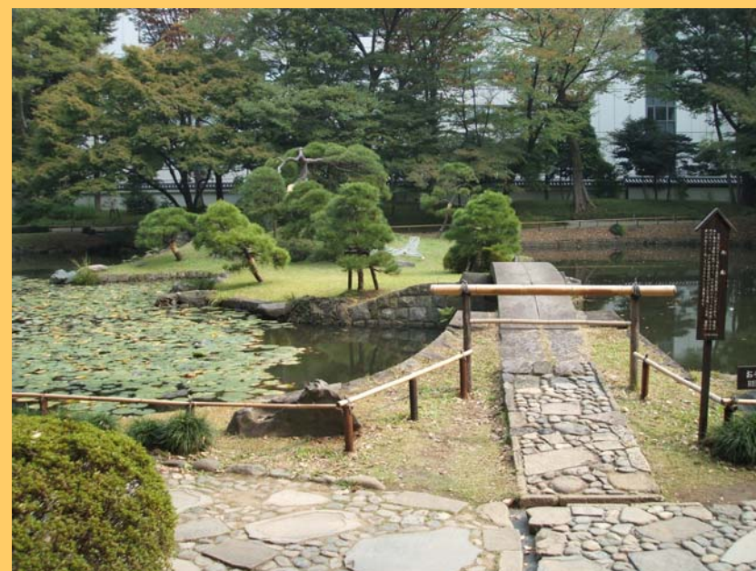
小石川後樂園 庭園風景