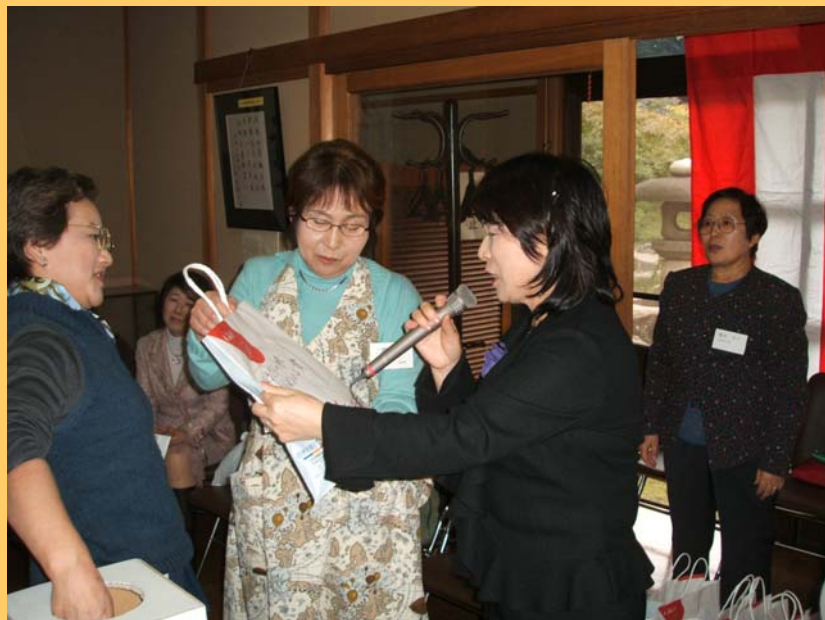
お楽しみ福引抽選